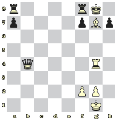
Diagram 5 – Bílý na tahu dá mat 1. tahem