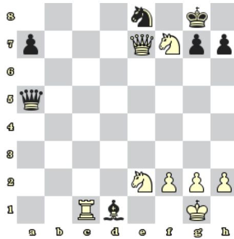
Diagram 6 – Černý na tahu dá mat 1. tahem