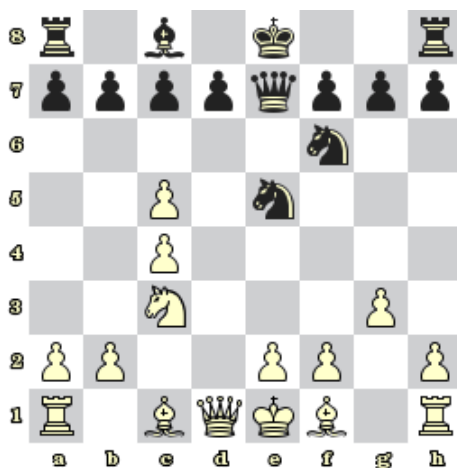
Diagram 5 – Černý na tahu dá mat 1. tahem