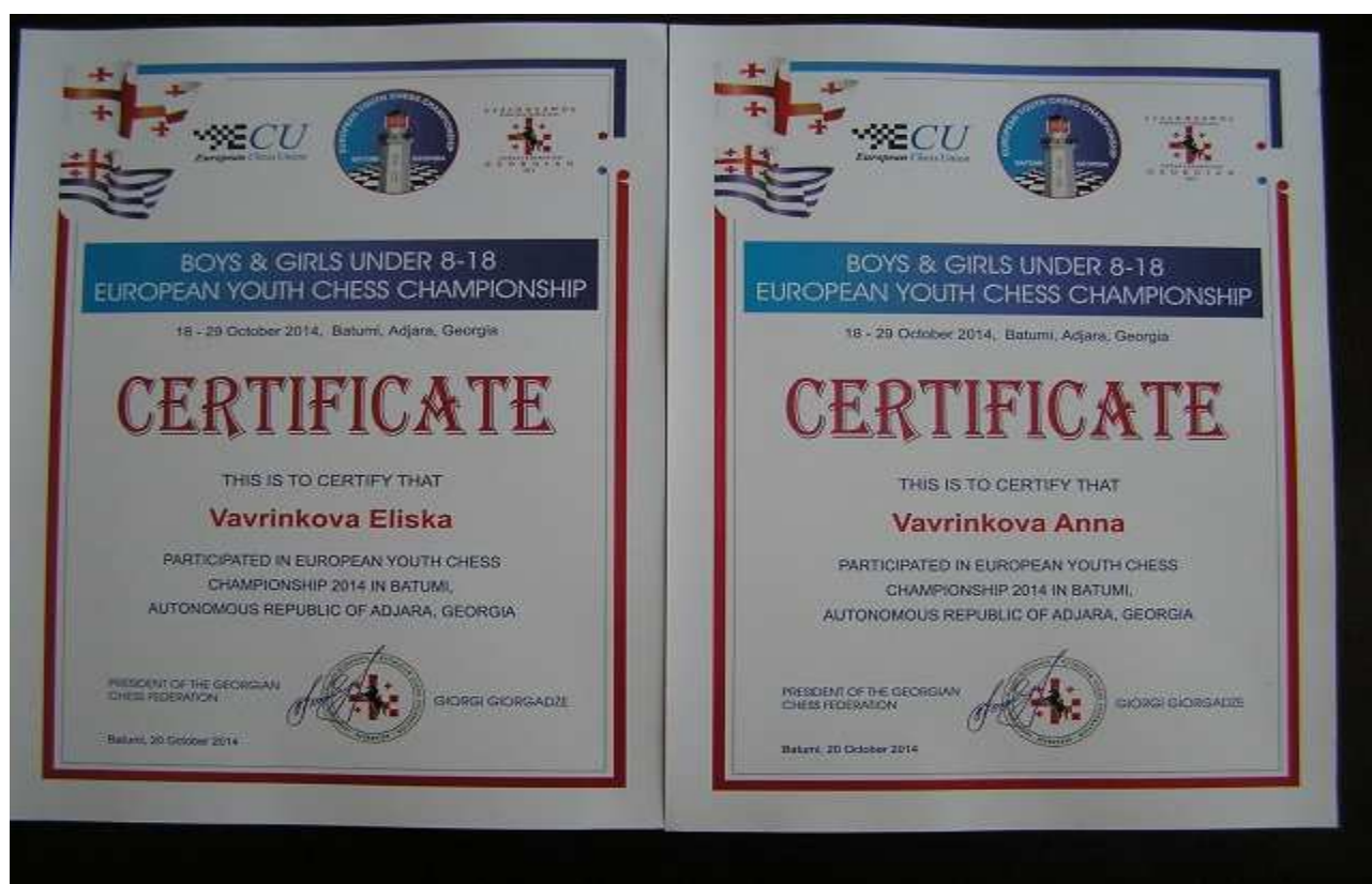
Pamětní účastnický certifikát pro hráče ME 2014 v Batumi

Následoval ještě rozbor partie Lucky a na hodinkách najednou bylo 20:45.