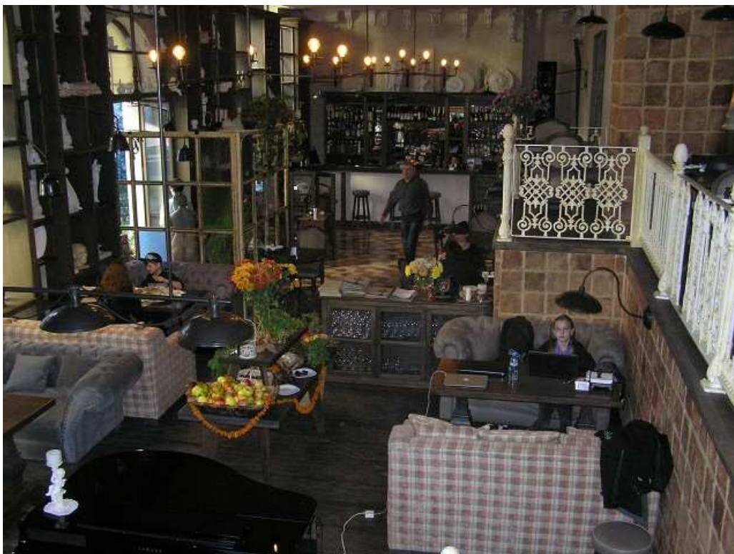
Restaurace BOULEVARD – atmosféra a spokojená Anička po zisku prvního bodu na ME

Postupně přicházejí další samé dobré zprávy a celkově dnes výrazně zlepšujeme bilanci z prvního kola.