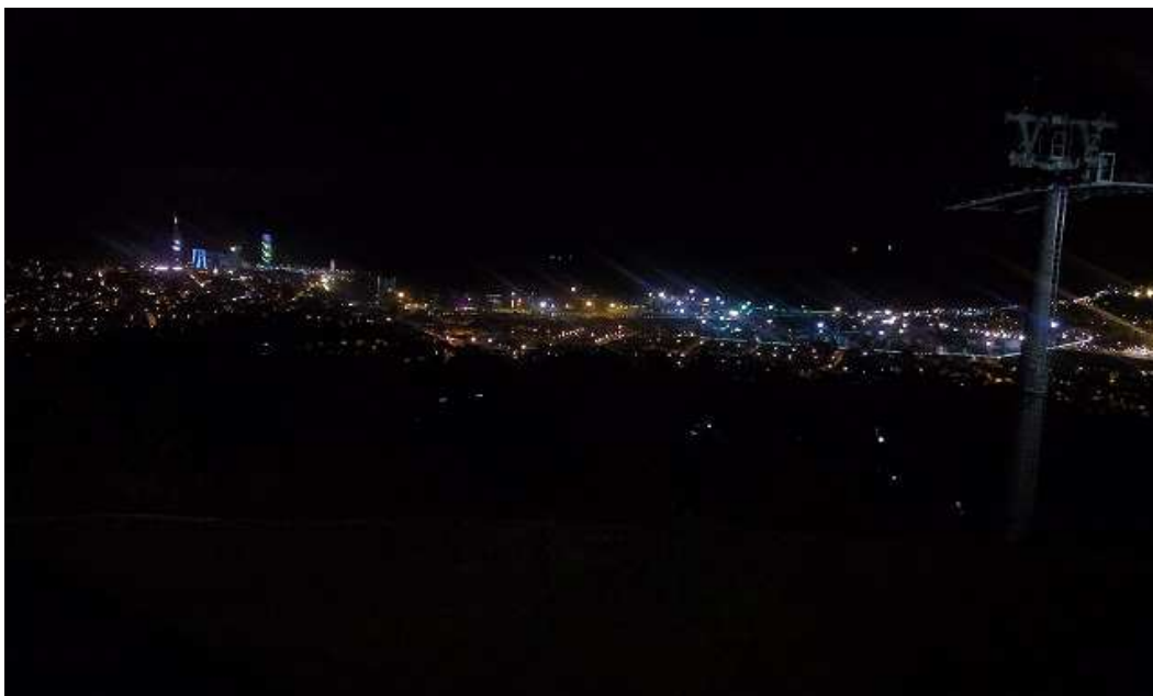
Noční pohled z horní stanice lanovky na osvětlené pobřeží Batumi.

Po analýze pospícháme na večeři, dnešní program totiž ještě nekončí, po jídle i s Davidem a Natašou jdeme na dohodnutý výjezd lanovkou nad Batumi. Je již tma, ale zcela jasno a doporučení pana Ambrože se potvrzuje. Z horní stanice lanovky jsou dolů krásné výhledy na osvětlené pobřeží, linie bulváru jasně definuje průběh mořského břehu.