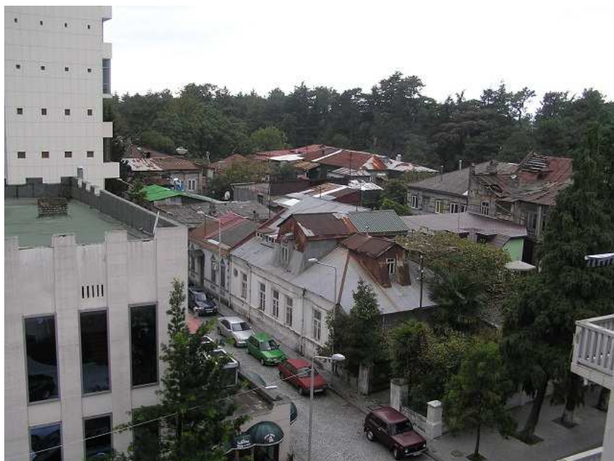
Pohled 2 – hlava se otočila cca o 90 stupňů – polorozpadající se všehočtu' různého druhu

Ale my bychom měli hlavně vybalit zavazadla. Na to je potřeba rychle spálit červa. Šup ho tam. Jelikož jsme tři, ale stále máme pouze dvě postele, nevím, jestli náhodou nebudeme ještě přesunuti na jiný pokoj. Ale pragmaticky to rozhoduje Eliška – přece nebudou uklízet další pokoj! Takže rozbalit kufry, načež Elsa volá: „Tati, tady něco vyteklo a nějak to smrdí☹“. I přesto, že cenné tekutiny byly před zabalením přelity do pet lahví a ještě zabaleny (naštěstí) do igelitových sáčků, jedná dávka nevydržela násilné přemístování zavazadel během leteckého transportu a výsledkem byla fernetová pečeť na zcela nových Šachových miniaturkách od Richarda Biolka.