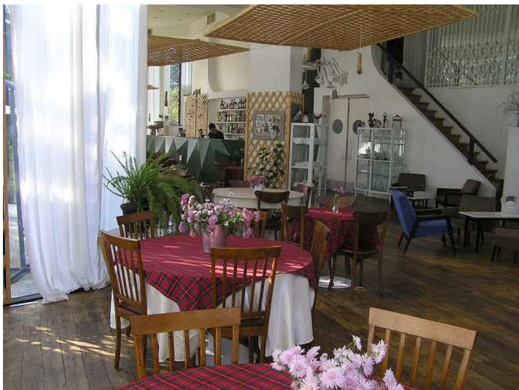
Velmi příjemný interiér kavárny Cafe Gardens.

Po zahájení 8. kola ihned odcházím do Cafe Gardens, kde jsem dnes dřív, než Ondra.