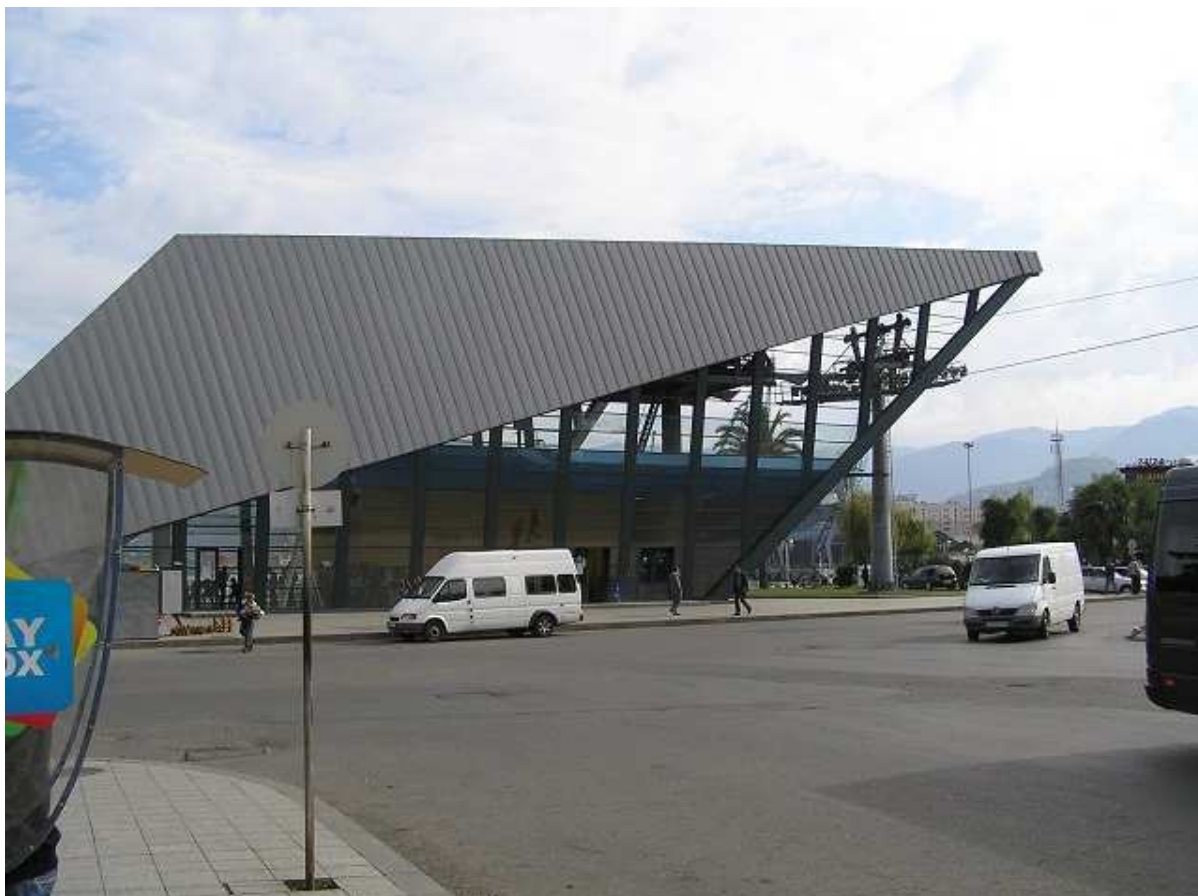
Spodní stanice lanovky, vedoucí nad Batumi

Domnívám se, že si nějak matně pamatuji cestu dál do města z našeho nočního příjezdu. Na kruháci tedy volím směr dál podél břehu moře, ale to je chyba. Za malinkou chvíli se ocitáme mezi polorozpadlými paneláky a malými téměř chatrčemi, holky jsou z toho dost rozhozeny. K tomu ještě ti naprosto bezohlední řidiči – asi jdeme blbě. Vracíme se tedy zpět na kruhový objezd a volíme jinou ulici, o 90 st. jiným směrem. Ta skutečně vede mezi civilizací, míváme konečně běžné krámky se suvenýry, nějaké větší kino, nakoukneme i do prvního supermarketu – ten má odhadem tak 25 m 2 a jsou v něm jen potraviny (a nějaké pití☺). Směnárna co 10 metrů, prodejna mobilů co 15 metrů, občas drogerie. Přejdeme jakési náměstí s kostelem. Všude pořád hrozný kravál, ale nějak nám to už nevadí. Na chodnících posedává docela dost žebráků, často s dětmi v klíně. A kousek vedle zase casino. Fakt mazec.