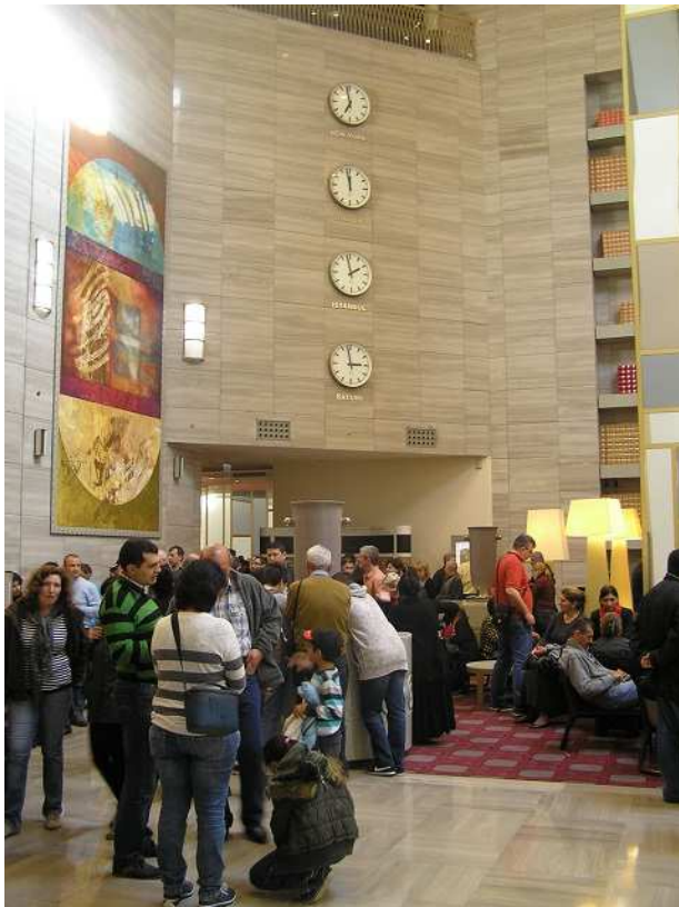
Luxusní, ale přeplněný foyer hotelu Sheraton.

Hotelové foyer je dnes totálně full a náš včerejší koutek je již bohužel obsazen. Holčám jsem slíbil, že určitě budu čekat TADY NĚKDE. 10 minut bezmocně korzuji a rozrážím si brašnou od nořasu bezcílnou cestu. Snack trochu osiřel, i někteří ostatní asi taky pochopili. Kozel v bagáži, místa nět, što nádo?